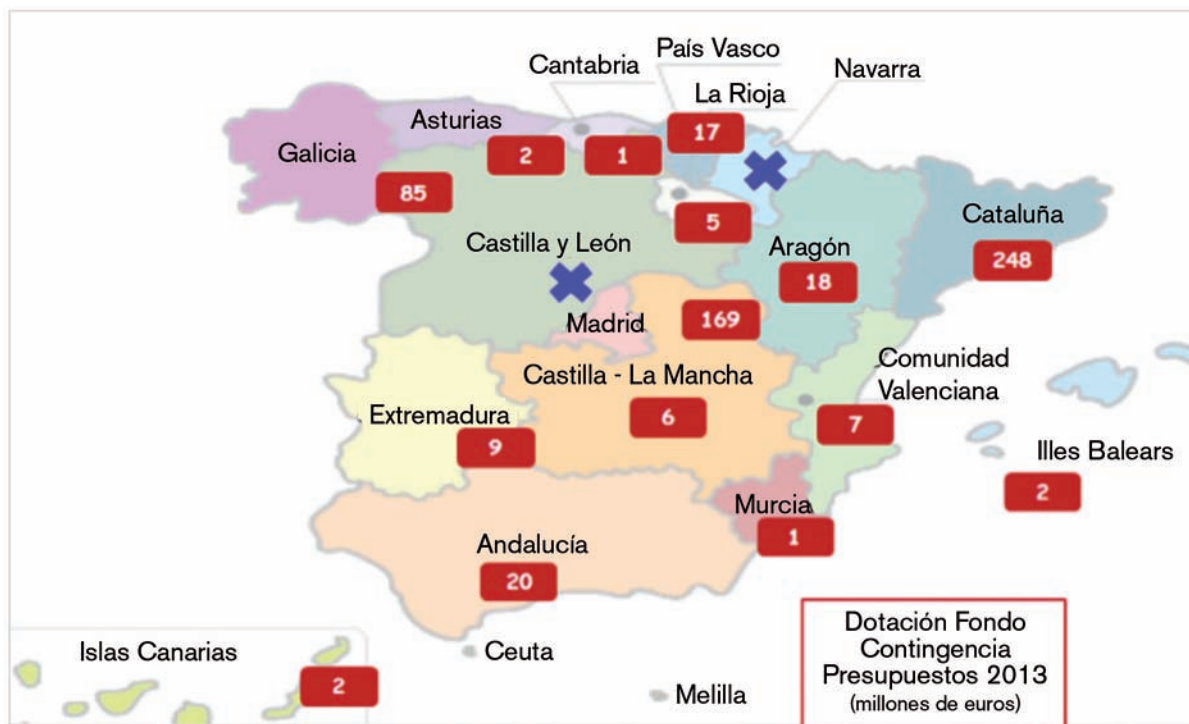
Figura 1: Dotación del fondo de contingencia en los presupuestos generales de las comunidades autónomas. Ejercicio 2013 (en millones de euros):